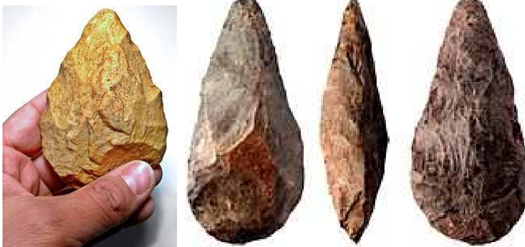
"aitzez" egindako bi aurpegietako aizkoren irudiak

Beraz, aitzoak arroka mota bat den sukarriz egiten ziren. Ikus dezagun orain aizkora mota bati buruz (bifaz), gaztelerazko Wikipedian zer dagoen: