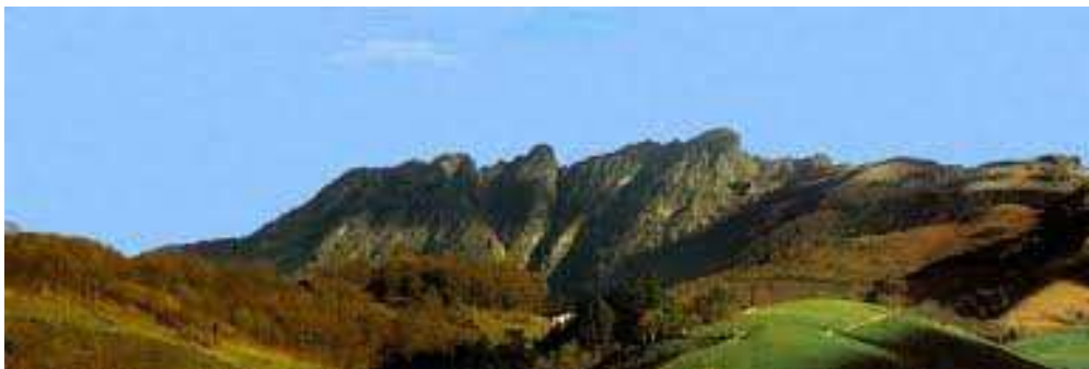
Aiako Harriak

Ondorioak: Orain arte aipatutako 10 arrazoi hauek kontuan hartuz, logikoa da pentsatzea “aitz” erroa duten hitz horiek paleolito garaikoak direla eta euskerak bere horretan eutsi diela. Eta Barandiaranek seguruenik asmatu zuela. Beraz gaur egun dagoen hipotesi sendoena dirudiela. Bestetik latinezko “ asciola ” hitz konposatua dela dirudi, lehengo osagaia beste hizkuntzetan agertutako “ax” izan daitekeelarik.