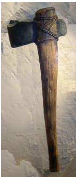
(Irudia: Uxio Noceda)

Kasu honetan, hizkuntza guztietan agertzen den erroa, ATX, bere aldagai guztiekin (ach, ax, adz, az...), gizakiak sortutako lehenengo aizkora izango litzateke, etimologia ezin argiago batekin.