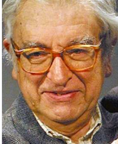
Jose Luis Alvarez Enparantza-Txillardegui