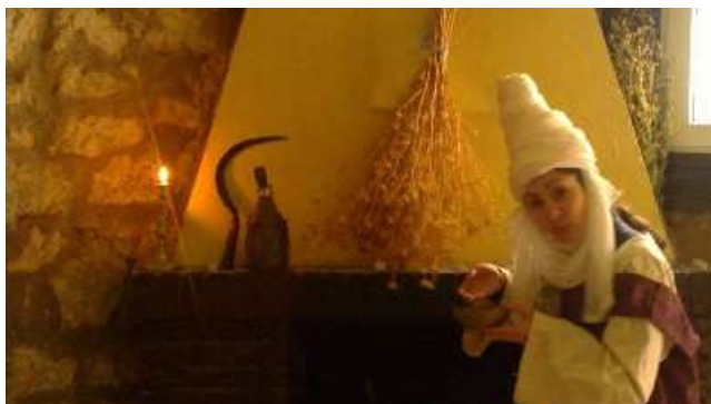
Irudia: Gasteizko Udala

Gakoa “mundu ikuskera” kontzeptua dugu: existentzia ulertzeko eta komunikatzeko ditugun egitura sakonen saskia. Erraz onar dezakegu bai mitologiak eta bai hizkuntzak dutela atzean mundu ikuskera bat: edozein mitologia sinboloen eta istorioen bidezko mundu ikuskera bat da, eta edozein hizkuntza hitzen eta kontzeptuen bidezko mundu ikuskera bat. Biak eskutik eskura zebiltzan garaietan sortuak eta eraldatuak izanik, argi dago, beraz, euskal mitologiaren eta euskararen atzean dagoen mundu ikuskera ezagutzea euskal gizartearen eta euskararen jatorria ulertzeko laguntza ordainezina gerta dakigukeela.