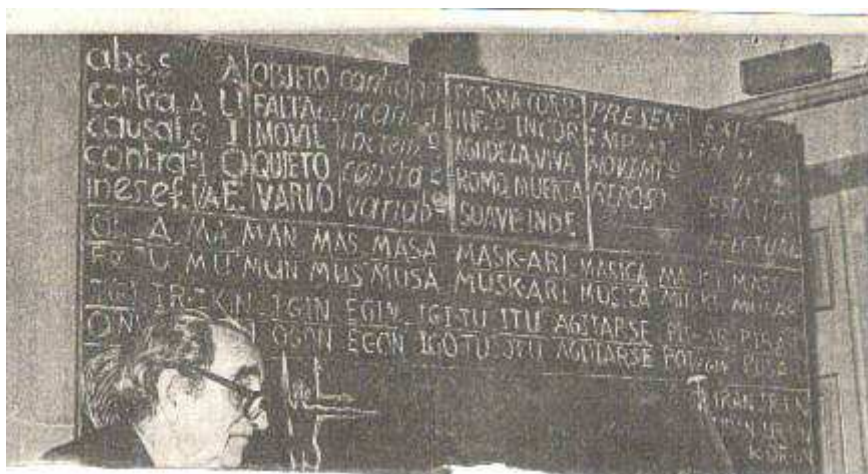
En el estudio del semantismo literal han de mantenerse los tres planos separados

Podremos seguir el semantismo literal y demostrarlo en ordenaciones matemáticas en el lenguaje sensorial; también en el idencial, a condición de captar la asociación de ideas. En el lenguaje mental no pueden seguirse demostraciones matemáticas ni puede demostrarse la proposición contradictoria, pues hay asociaciones que efectivamente sólo se pueden “cazar”.