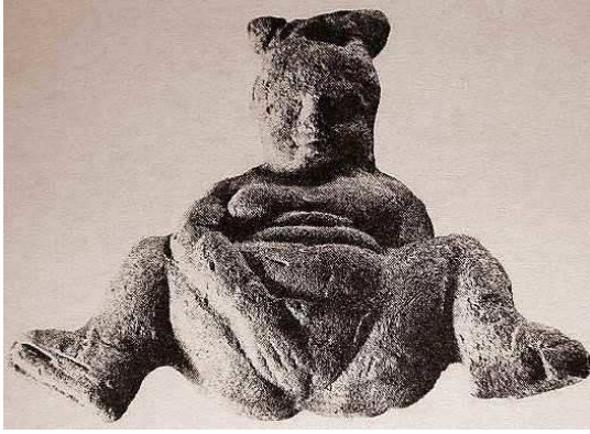
Baubo griega. Misterios eleusinos