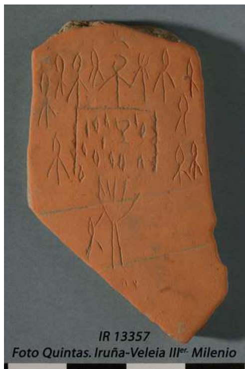
Última cena. Iruña-Veleia IR 13357

La compañera del Salvador es María Magdalena. Pero Cristo la amaba más que a todos los discípulos, y solía besarla a menudo en la boca. El resto de los discípulos se sentía ofendido... Le decían '¿Por qué la amas más que a todos nosotros?' El Salvador contestó diciéndoles: '¿Por qué no os quiero como la quiero a ella?'