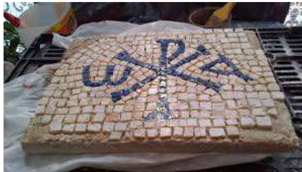
Crismón de Pompeya, siglo I

En cuanto al Crismón o anagrama de Cristo, que consistiría en las dos primeras letras X (chi) y P (rho), - que según la interpretación católica se le apareció con la leyenda de in hoc signo vinces - parece que era muy anterior, ya que fue hallado en una tumba de Pompeya dos siglos y medio antes 82 . Según algunos autores, el monograma o criptograma representa la palabra griega chrestón , que significa “auspicioso” y que puede estar relacionada con la victoria de Constantino en Puente Milvio. Lo apunto por lo del crismón de Veleia.