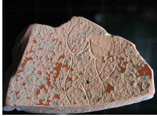
La llamada "venus" de Veleia