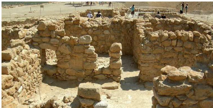
Ruinas esenias de Qumram, 134 a.C.

Refiriéndome al cristianismo, que es lo que nos ocupa, tengo que decir que su origen judío se remonta hasta una secta llamada de "los terapeutas" y otra más conocida como los "esenios". Los primeros fueron más contemplativos y grandes conocedores de las plantas curativas; los segundos, más intelectuales y moralistas. Ambas provienen, a su vez, de un sincretismo entre judaísmo y paganismo en gran parte pitagórico. Con el imperio de Alejandro Magno las culturas del Mediterráneo adoptaron el griego como lengua vehicular, la koiné , que significa común u oficial. Eso hizo que el gnosticismo se expandiera exponencialmente, ya que los gnósticos paganos, judíos y cristianos escribían en griego.