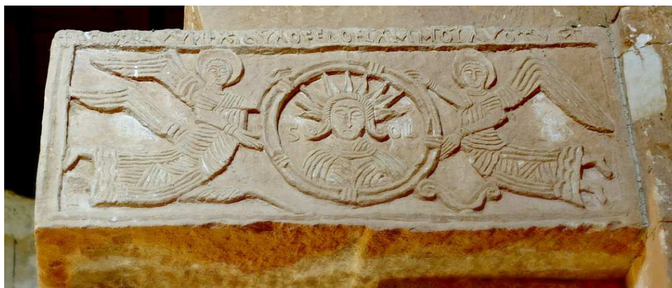
Quintanilla de las Viñas (Burgos)

Representaciones similares aparecen igualmente en una ermita, de origen priscilianista, de Quintanilla de las Viñas, cerca de Burgos. En un medallón, a la izquierda del frontispicio de la ermita, aparece un rostro femenino, que sobre la cabellera lleva un cuerno lunar, mientras que a la derecha se representa el rostro de un hombre, coronada la cabeza por nueve rayos solares. 81