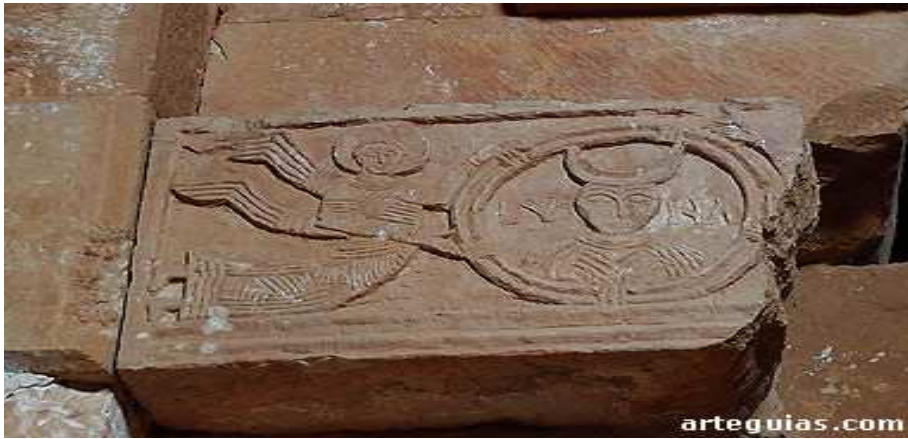
Quintanilla de las Viñas (Burgos)

En relación a la conversión de Constantino, no parece que se trate de una conversión cristiana, sino pagana, ya que esta revelación la tuvo en un templo consagrado a Apolo, que es un dios solar, que se adoraba en ciertos cultos bajo el nombre de Sol Invictus . La religión de Constantino, que se ha confundido con el cristianismo, era la del culto al Sol, religión del Imperio en ese momento por influencia del mithraísmo. De hecho, Constantino no fue bautizado hasta el 337, cuando yacía en su lecho de muerte sin fuerzas para rechazar nada.