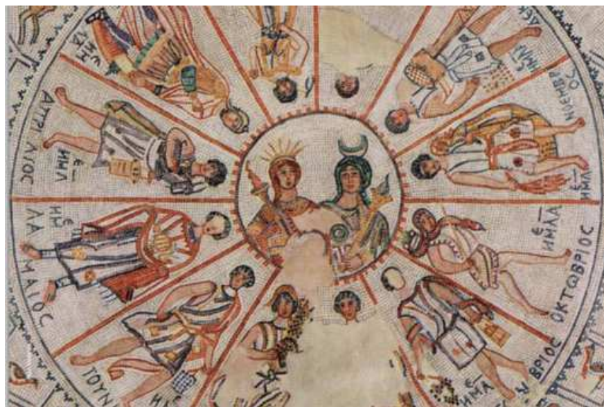
Mosaico en el yacimiento de Tell Beit She'an (Turquía)

Como curiosidad, traer a colación que en el yacimiento de Tell Beit She'an (actual Turquía) en el contexto del monasterio bizantino de Nuestra Señora María, se encontró un mosaico del siglo III con las figuras deificadas del Sol y la Luna, rodeados por un calendario de diseño hebreo, que se ha interpretado como la representación de Jesús Sol Invictus y María Magdalena como sacerdotisa de Artemisa o bien el Espíritu-Sofía, muy propio de la iconografía gnóstica.