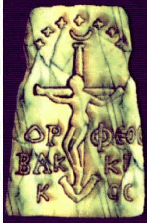
Orfeo Bakki crucificado