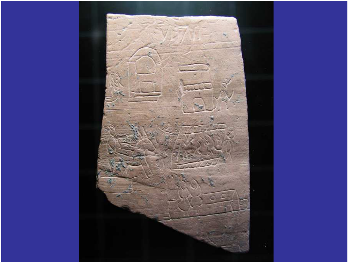
Graffiti de Iruña-Veleia - Vitae - Una persona en actitud reverencial de rezo ante la Puerta Sagrada. (esquina superior izda).