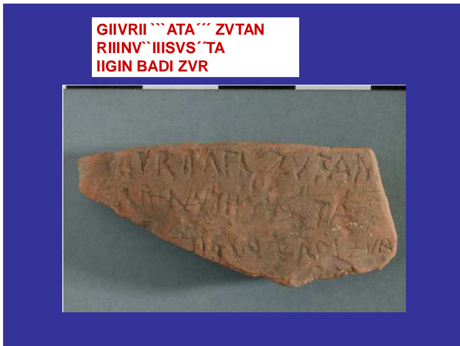
Graffiti de Iruña-Veleia - "Nuestra "Puerta" ardiendo (primera línea) La Puerta Sagrada y el Fuego