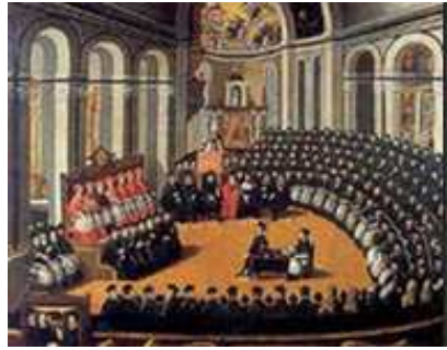
Primer concilio ecuménico celebrado en Nicea en el año 325.

“colaboración” de los obispos de la iglesia y por ello convoca el Concilio de Nicea, un hecho de suma importancia tanto en clave política, como en clave de unificación religiosa del imperio 137 .