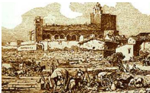
Campamento de Peregrinos en Saintes-Maries-de-la-Mer en 1852

La gran tradición masónica francesa. La masonería en cualquiera de sus Ordenes o Logias siempre ha tenido una doctrina esotérica, según todos ellos basada “en el verdadero conocimiento”. En Francia (y en el resto de occidente) todas las Logias se autoproclaman herederas (tras un más o menos largo árbol genealógico) de la Orden del Temple y de los conocimientos que estos descubrieron en las ruinas del Templo de Jerusalén (bajo la Gran Roca), no reconociendo la deidad encarnacionista de Jesús. Ese cuerpo esotérico es muy análogo en las grandes ramas de la masonería francesa: Gran Logia de Francia 172 (en la actualidad supera los 30.000 hermanos ), Priorato de Sión 173 , Rosa Cruces, etc.; todas guardan el “secreto del Santo Grial” como la “copa portadora de la sang real ”, el útero de María Magdalena, mujer clave en el cuerpo de la masonería francesa, y que afirman que tras la muerte de Jesús vivió y murió en Francia.