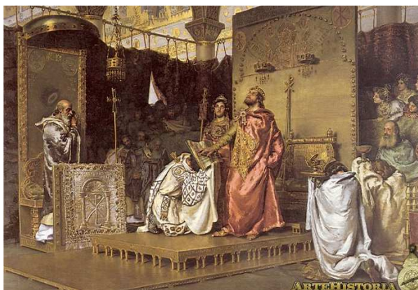
Óleo de Antonio MUÑOZ DEGRAIN, 1888 (expuesto en el Senado): La conversión de Recaredo.

Recaredo sucedió en el trono a su padre Leovigildo, se convirtió y adoptó el catolicismo como religión oficial del pueblo godo, en el desarrollo del III Concilio de Toledo en el año 589 155 . Iglesia y monarquía se unen para sostenerse mutuamente. Isidoro afirma: “Dios concedió la preeminencia a los príncipes para el gobierno de los pueblos” . Así la jerarquía eclesiástica aunada con el poder asume funciones hasta entonces impensables: velará por el recto proceder de las autoridades civiles, y como consecuencia de ello los obispos pasaron a ejercer unas funciones rectoras muy superiores a las que ya venían asumiendo. De acuerdo con estos principios teóricos, no debe sorprender que uno de los cánones aprobados en el III Concilio de Toledo (canon 18) encomendase a los obispos la supervisión de jueces y recaudadores, ni que éstos pudieran llegar a ser sancionados con penas espirituales, como la excomunión.