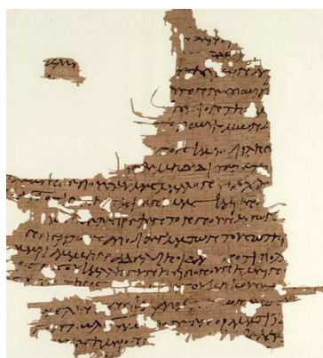
Evangelio de María Magdalena (Codex Berolinensis, hallado en 1896, ver nota 54)

"En su vehemente deseo de dilatar los dominios de la fe ciega, los primeros teólogos cristianos (de la iglesia romana) ocultaron tanto como les fue posible las fuentes de su ciencia, y al efecto se dice que entregaron a las llamas cuantos tratados de cábala, magia y ocultismo hallaban a mano, creyendo equivocadamente que con los últimos gnósticos habían desaparecido los manuscritos más peligrosos de esta índole" (Helena Blavatsky, Isis sin Velo, Vol. III, 31).