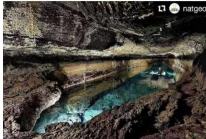
Imagen de Robbie Shone en la Cueva de los 7 Lagos, Túnel del Volcán de la Corona, Haría, Lanzarote. Islas Canarias.

No vemos monedas, solo agua y rocas, y por ahí han de ir los tiros, comenzamos por el final: