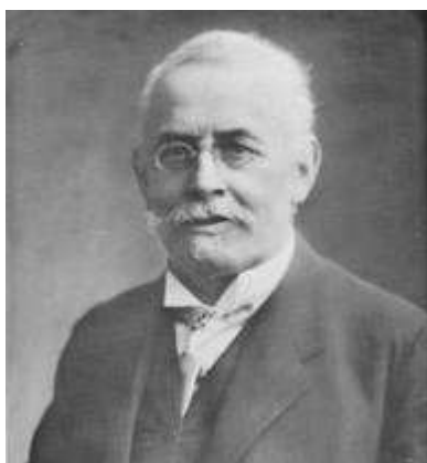
Hugo Schuchardt hizkuntzalari eta euskaltzale alemaniarra Gotha, 1842 - Graz, 1927