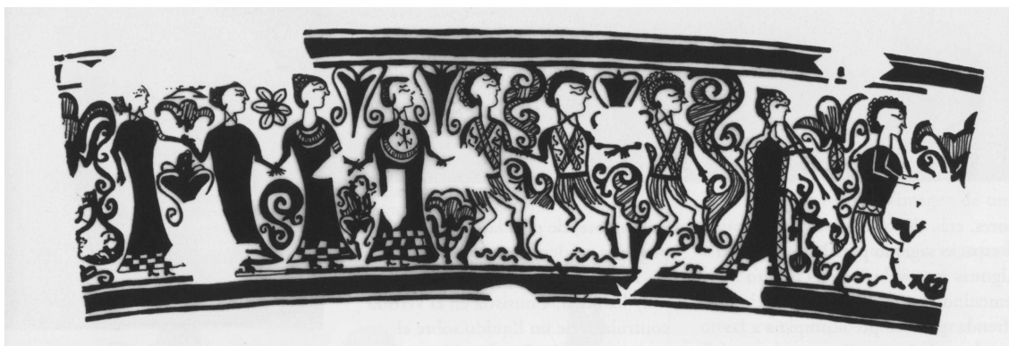
Baile ibérico encontrado en las cerámicas de San Miguel de Liria (la Edeta ibérica). Siglo III antes de Cristo.