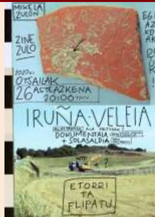
Oreretako hitzaldiko kartela

Baina epaileak ez duenez grafitoak Europako 3 laborategi onenetara bidaltzen utzi, epaia bat edo beste bat izan berdin utziko gaitu. Beste 11 urte horrela datazio serioen bila?