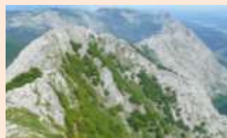
Euskal sena (eus)

Sortu duten webgunean material ugari eta interesgarria: